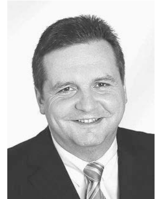
Mappus, Stefan CDU Ministerpräsident a. D.; * 1966; Westliche Karl-Friedrich-Straße 104, 75172 Pforzheim; Direktmandat WK 42 (Pforzheim)