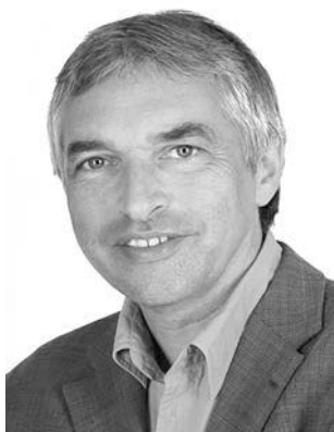
Walter, Jürgen BÜNDNIS 90/DIE GRÜNEN Politischer Staatssekretär; * 1957; Stuttgarter Straße 62, 71679 Asperg; Zweitmandat WK 12 (Ludwigsburg)