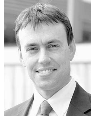
Dr. Schmid, Nils SPD Minister für Finanzen und Wirtschaft, stellv. Ministerpräsident; * 1973; Gerberstraße 4, 72622 Nürtingen; Zweitmandat WK 60 (Reutlingen)