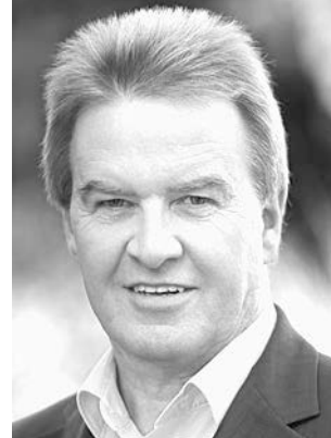
Untersteller, Franz BÜNDNIS 90/DIE GRÜNEN Minister für Umwelt, Klima und Energiewirtschaft; * 1957; Jettenhartstraße 5, 72622 Nürtingen; Zweitmandat WK 3 (Stuttgart III)